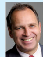
Werner Tiki Küstenmacher

Bestsellerautor, evangelischer Pfarrer und Karikaturist